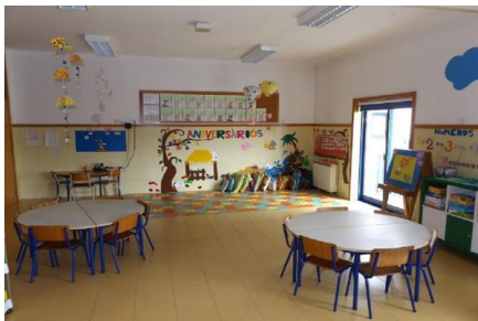
Imagem 13: Sala Pré 1

Nas salas desta resposta encontram-se diferentes áreas, tais como: área da casinha, área do acolhimento, área das construções, área dos jogos, área da biblioteca, área da expressão plástica e área do conhecimento do mundo.