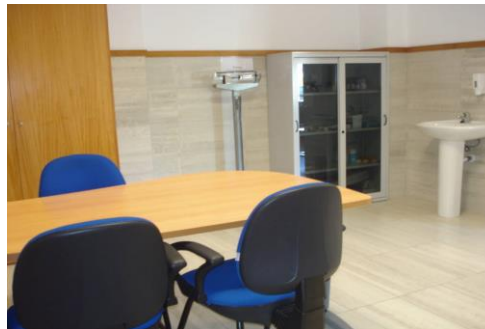
Imagem 20: Posto Médico

Para além destas atividades, os clientes podem usufruir de serviços de saúde (enfermagem), tanto no domicílio como nas instalações do Centro Social Paroquial da Borralha.