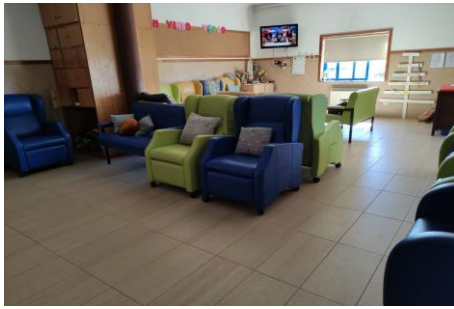
Imagem 17: Sala de descanso