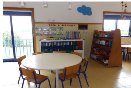
Imagem 14: Sala Pré 2

A equipa de trabalho desta Resposta Social é composta por duas Educadoras e duas Ajudantes de Ação Educativa.