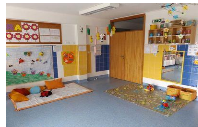
Imagem 12: Sala Creche III

Esta resposta social conta com o trabalho de duas Educadoras e quatro Auxiliares da Educação, divididas pelas diferentes salas.