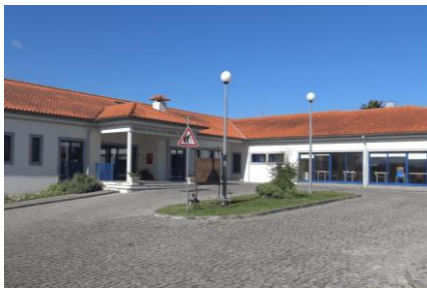
Imagem 6: Edifício novo

O Centro Social Paroquial da Borralha é composto por dois edifícios: uma casa de habitação (Casa Casal Lito), do tipo secular, com dois pisos, que foi alvo de intervenção ao nível das infra-estruturas, através de uma candidatura ao POPH, com vista à implementação da resposta social Residência Autónoma, cuja atividade teve início em 1 de dezembro de 2013. O edifício sede, com dois pisos, inaugurado em julho de 2007. Neste edifício funcionam as respostas sociais ao nível da infância: CATL, Pré-Escolar e Creche. Ao nível da terceira idade funcionam o Serviço de Apoio Domiciliário, o Centro de Dia e Convívio. Dispomos ainda de uma resposta de apoio à comunidade, o Atendimento e Acompanhamento Social. A instituição dispõe de vários gabinetes e serviços, tais como: Secretaria, Direção, Direção Técnica, Educadoras, Gabinete Médico, Gabinete de Apoio, Higiene e Saúde, Lavandaria e Cozinha.