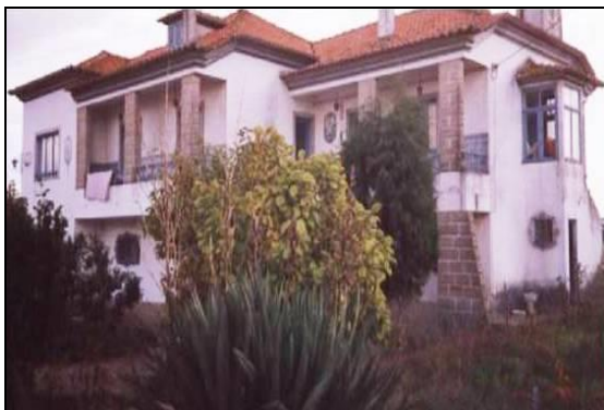
Imagem 4: Centro Social e Paroquial da Borralha em 1992

O Centro Social Paroquial da Borralha, foi fundado em 7 de julho de 1992, tendo como instalações a casa doada pelo casal Lito, sita no lugar do Brejo, Borralha.