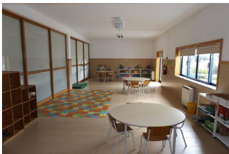
Imagem 15: Sala 1 CATL

Durante os períodos de interrupção letiva são organizados miniprojetos que oferecem às crianças um vasto leque de atividades, tais como: idas ao cinema, viagens de comboio, visitas à biblioteca, dinamização de ateliers de ciência e culinária, visitas a monumentos, idas à piscina, aulas de dança, ginástica, entre outras.