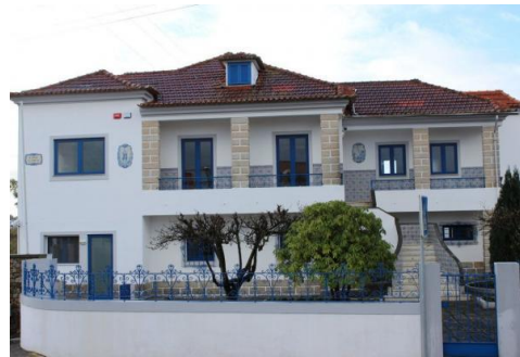
Imagem 25: Fachada Frontal

O principal objetivo desta resposta é desenvolver e promover a aquisição de competências em diversas áreas, que facilitem a integração e aceitação destas jovens na comunidade. De um modo geral pretendemos ser um suporte à autonomia afetiva, social e pessoal de cada um.