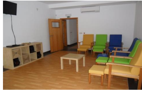
Imagem 27: Sala de Descanso