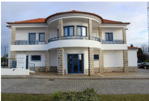
Imagem 24: Fachada Traseira da RA

A funcionar no edifício “Casal Lito”, 365 dias por ano, esta resposta social com características de uma habitação familiar, tem capacidade para 5 jovens/adultos com capacidade para viver de forma autónoma, mediante apoio.