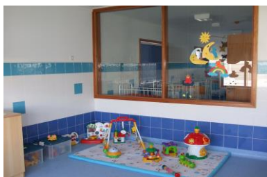
Imagem 10: Sala Creche I

As atividades desenvolvidas com as crianças dos 4 meses aos 3 anos de idade pretendem fomentar o progresso das crianças em termos físicos, linguísticos e sociais, assentando numa abordagem sensório-motora.