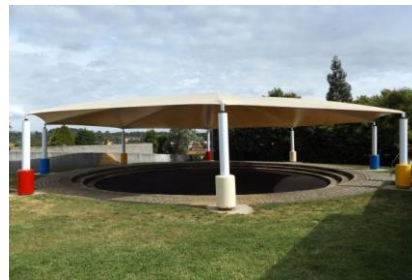
Imagem 9: Anfiteatro