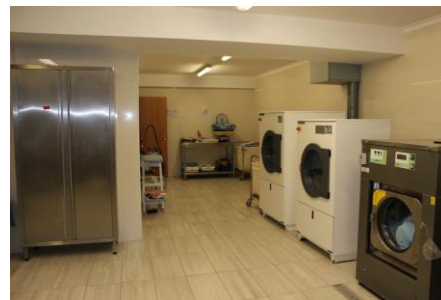
Imagem 22: Serviço de Lavandaria

Esta resposta social tem como responsável uma Psicóloga e conta com o trabalho de três Ajudantes de Ação Direta e de uma Auxiliar de Serviços Gerais.