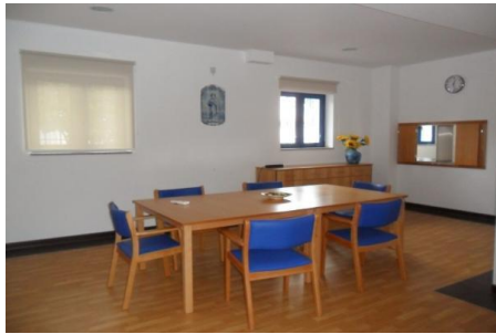
Imagem 26: Sala de Jantar