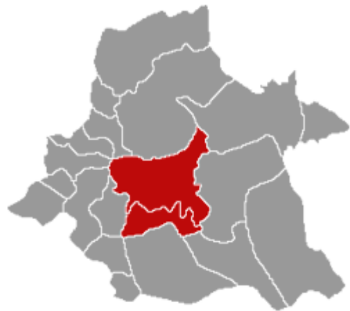
Imagem 2: Mapa do Concelho de Águeda (CMA, 2014)