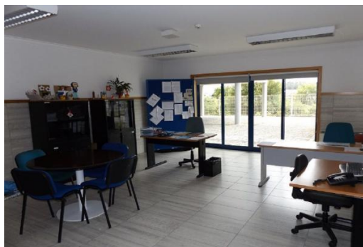
Imagem 23: Gabinete de Atendimento e Acompanhamento

Esta resposta também intervém, sempre que necessário, ao nível das outras respostas existentes na instituição, dando apoio a todos os clientes, sempre que necessário.