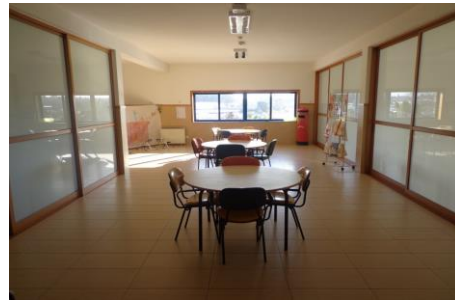
Imagem 18: Sala de Atividades

A equipa responsável pela dinamização destas respostas sociais é constituída por uma Psicóloga, uma Ajudante da Ação Direta, uma Auxiliar de Serviços Gerais e duas Animadoras.