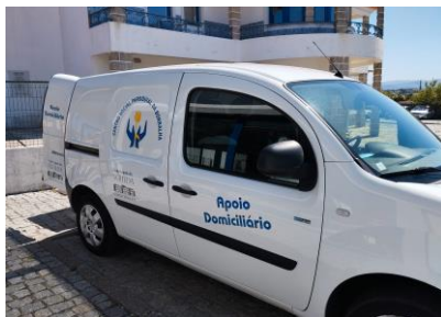
Imagem 21: Viatura do Serviço Apoio Domiciliário