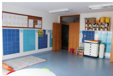
Imagem 11: Sala Creche II