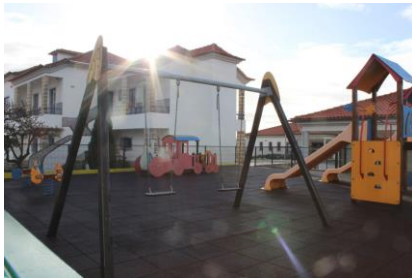
Imagem 8: Parque Infantil